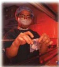
The SGH Skin Bank processes and stores donated skin.

Kulit yang didermakan ini digunakan sebagai penutup atau balutan sementara bagi menutup bahagian luka yang teruk untuk mengurangkan kesakitan dan ketidak selesaan pesakit. Ia juga dapat mengurangkan kehilangan cecair yang penting dari badan. Ini juga dapat memberi harapan dan sokongan moral pada